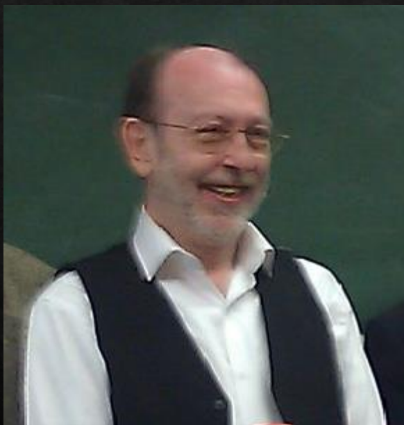
ALAIN DE BENOIST

współzałożyciel Nouvelle Droite w latach 60.